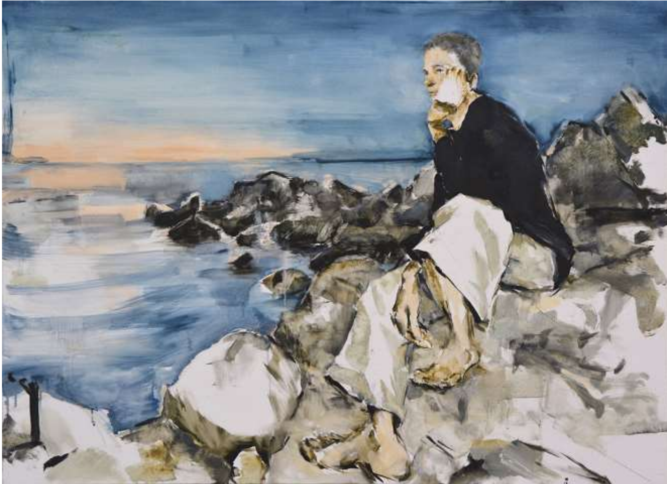
Postcard from the Edge 73x100cm Oli sobre tela