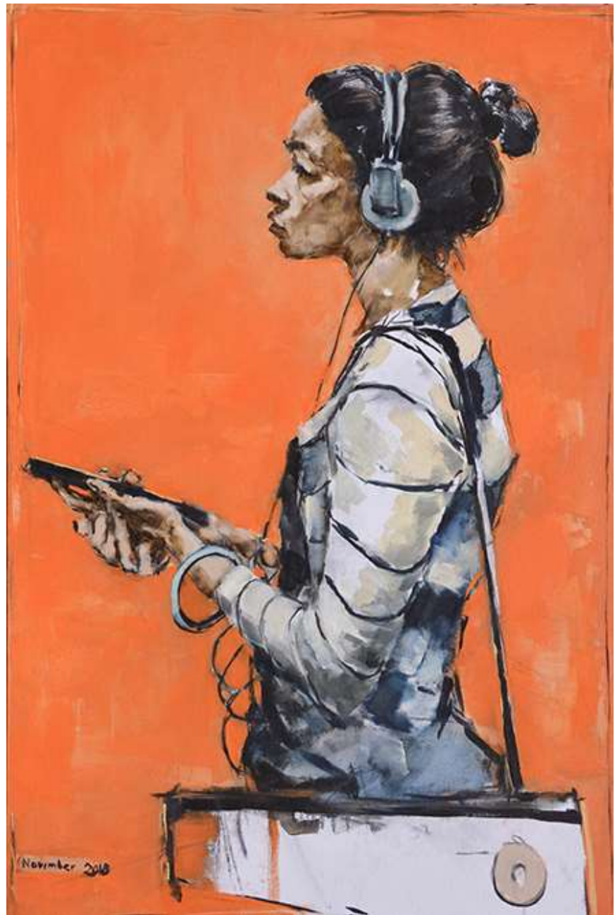
Looking at people looking at art, #2 (Le douanier Rousseau) 107 x 82 cm Oli sobre tela