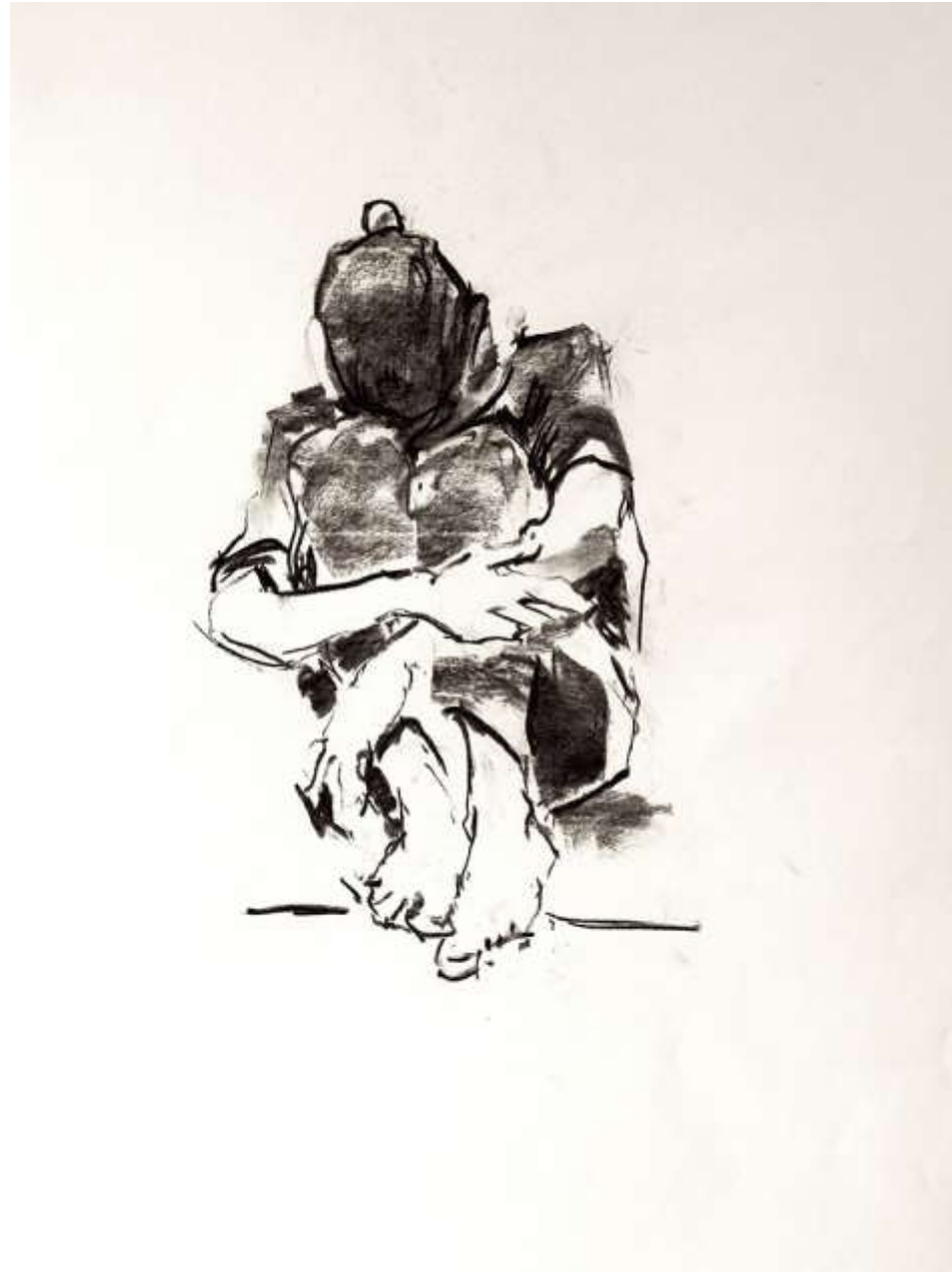
She 70x50cm Carbó sobre paper