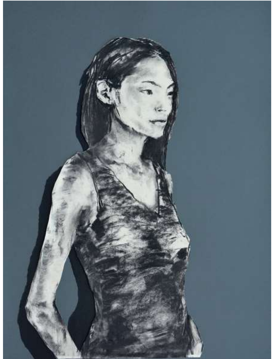
Shibuya 80x60 cm Carbó i collage sobre paper