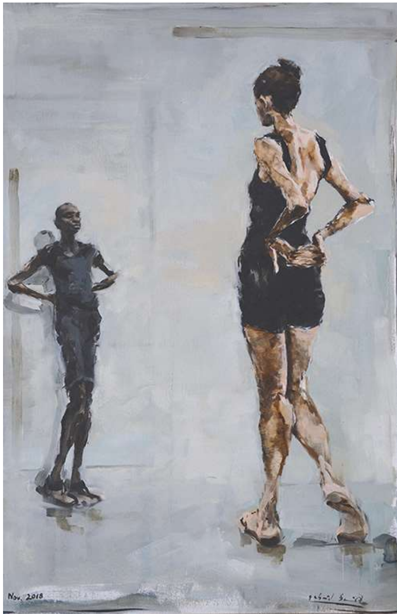
Face to Face 110x72cm Oli sobre tela