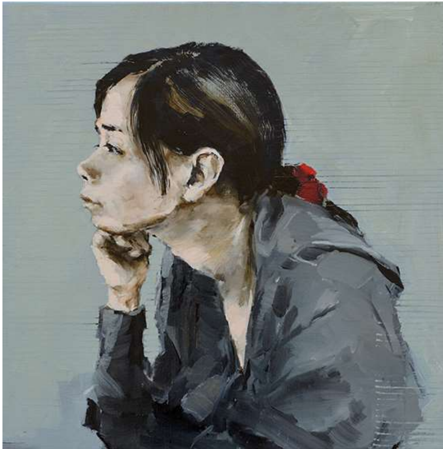
Shinjuku, somnian amb Japó 50x50cm Oli sobre tela