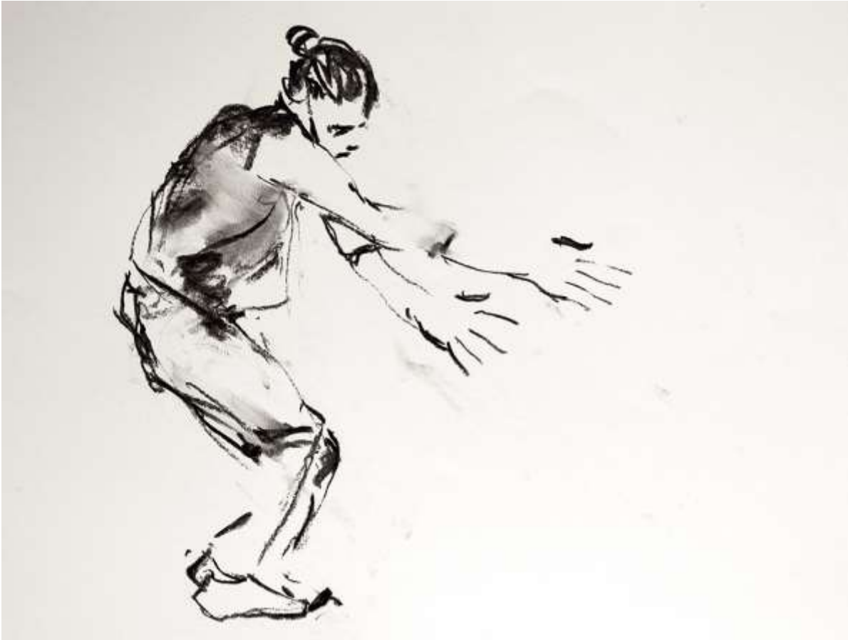
Dancer 50x70cm Carbó sobre paper