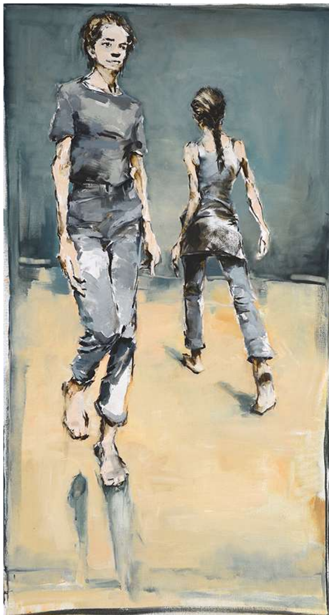
Pas de deux 134x72 cm Oli sobre tela