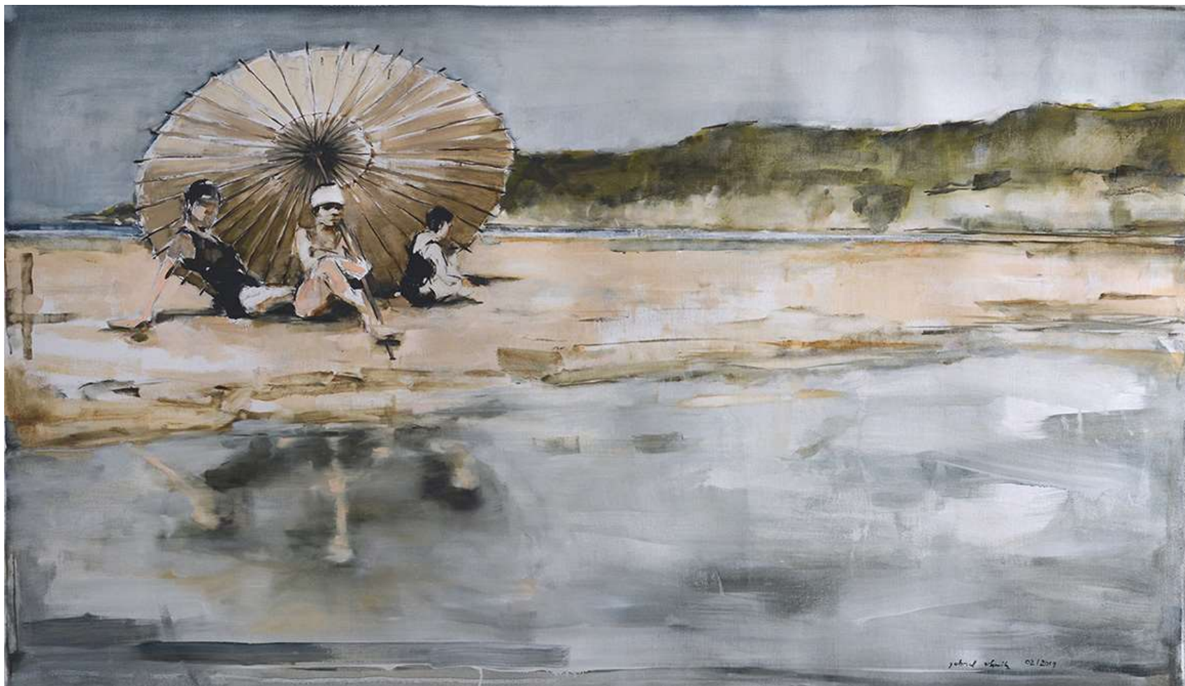
La plage 104x182cm Oli sobre tela