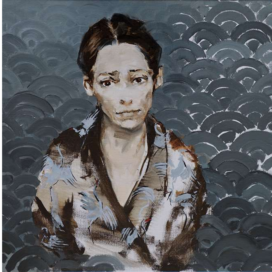
Mil grullas 50x50cm Oli sobre tela