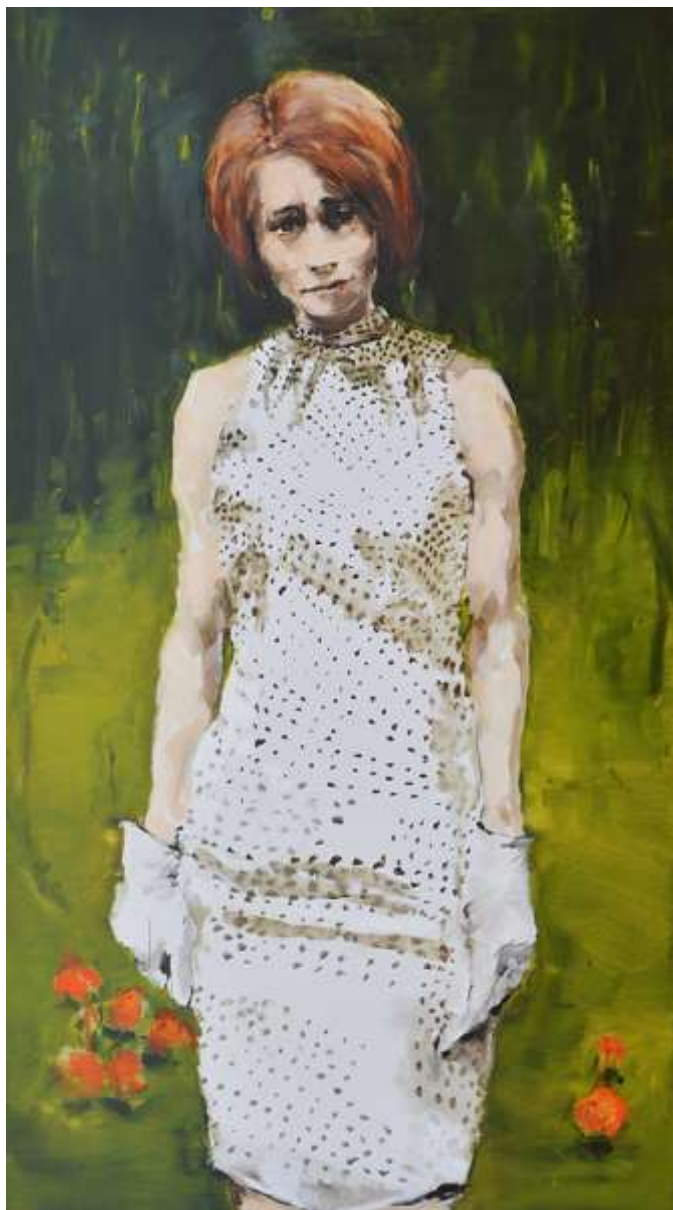
The Dress 130x73cm Oli sobre tela