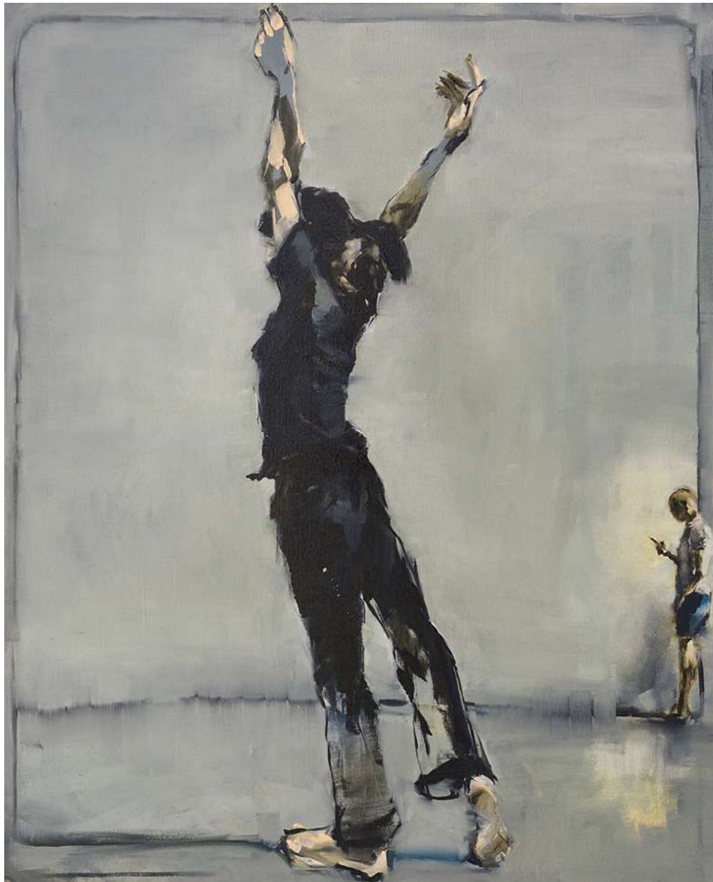
Megumi Eda 100x81cm Oli sobre tela