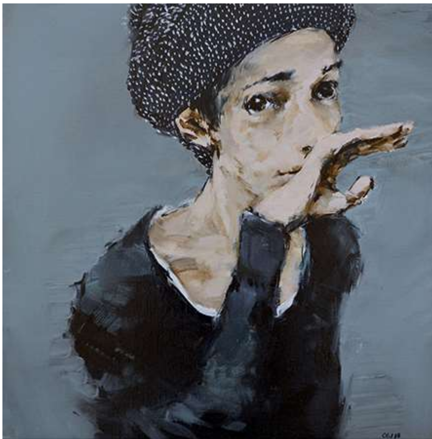
De paso 50x50cm Oli sobre tela