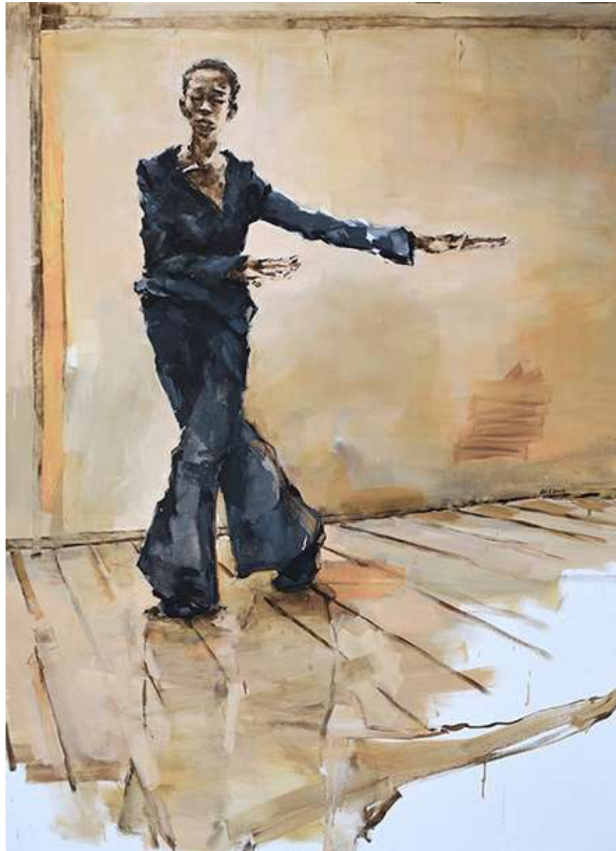
Bach (La Maga) 180x130cm Oli sobre tela