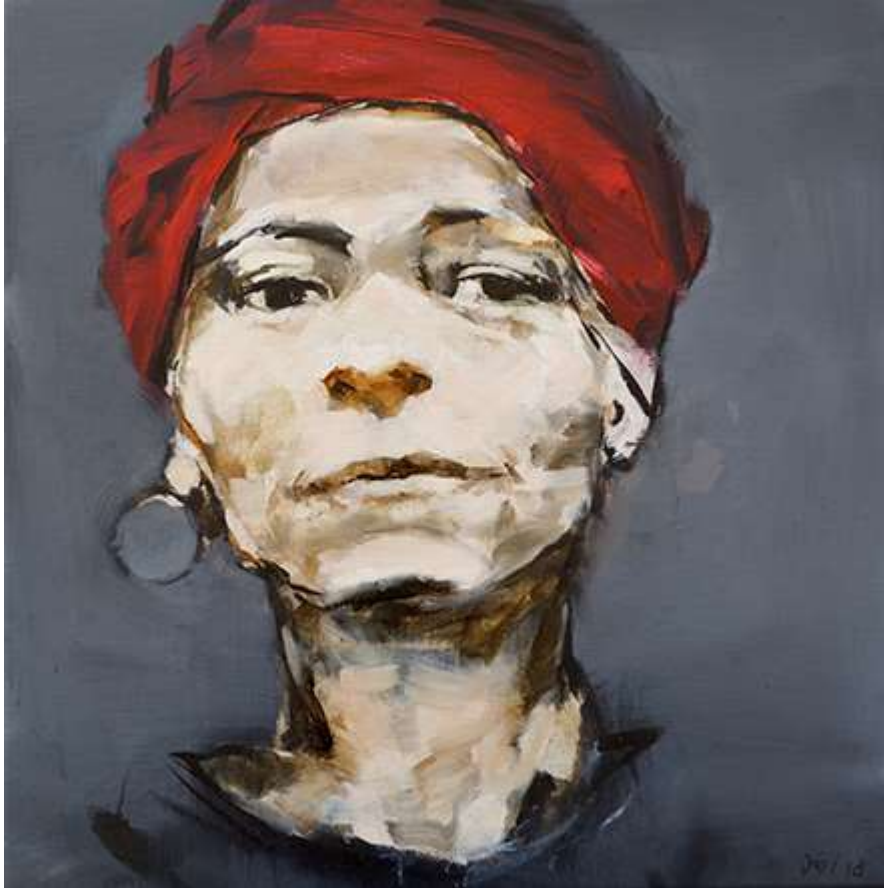
Rosa con rojo 50x50cm Oli sobre tela